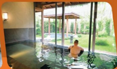
很多朋友看到這張相，都以為我去了日本浸溫泉，沒想到真正的地點竟然是清邁。