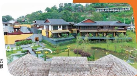
清邁有很多環境優美的酒店，是泰國另一度假之熱門選擇地。

此外更加有充滿藝術情懷的art village，村裏面有得買有得食，而且亦有親子活動，之前的節目中已去過清邁一次，老實講就算日後有第五輯，也不會再去，但無奈清邁又多新事物，所以決定把這些新環節拍攝下來，放上big big channel跟大家分享，名字就是《冲遊泰國4.1》，記得留意big big channel啦！📺